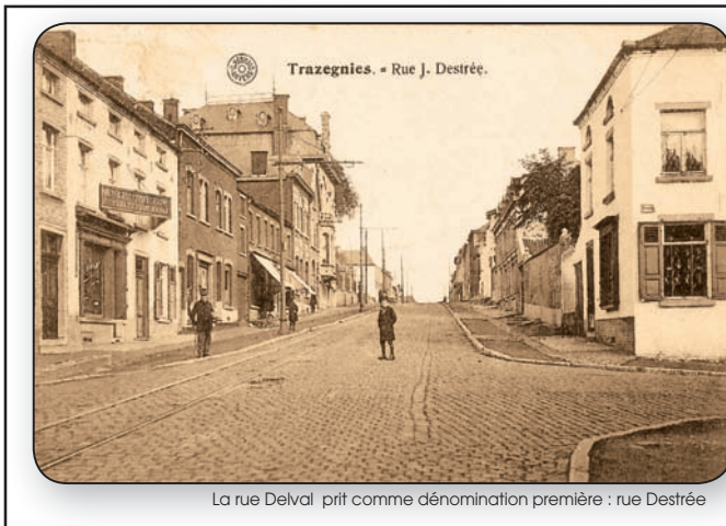
La rue Delval prit comme dénomination première : rue Destrée