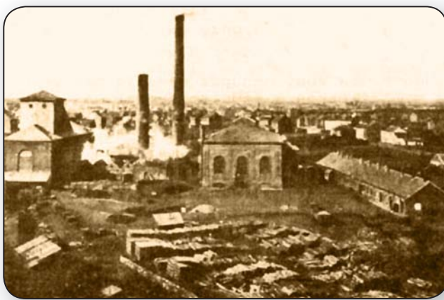
S.A. des Charbonnages de Courcelles Nord, puits n°8. Était situé le long de la route de Trazegnies. Le 7 mars 1923, un accident, dû à un coup d'eau entraîna la mort de 10 mineurs

Rue de la Croisette 56 • 6180 COURCELLES Tél.: 071 45 56 11 • 0499 29 08 55 decorock@skynet.be Fax: 071 46 01 37 www.decorock.be