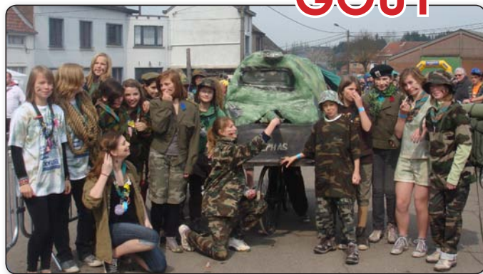
L'équipe gagnante pose fièrement devant son vélo char

Malgré un temps froid mais sec, de nombreuses équipes ont apporté de la bonne humeur, du sport et du folklore au sein de notre petite commune.