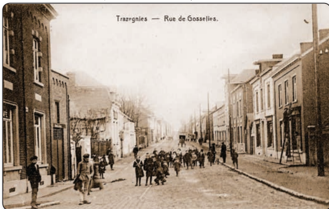
Trazegnies — Rue de Gosselies.

Après avoir fait l'historique de la rue Delval et la rue de Chapelle, il est tout-à-fait normal d'en étudier le dernier tronçon qui traverse en ligne droite notre localité, c'est-à-dire: la rue de Gosselies. De nos jours, cette belle artère qui nous conduit à Courcelles semble être là depuis toujours, avec certes, des améliorations modernes (éclairage etc.). Pourtant, il n'en fut toujours pas ainsi pour la raison pure et simple, qu'elle fut créée de toutes pièces